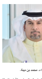
د. محمد بن ذية

أعلن الدكتور محمد مبارك بن ذية الرئيس التنفيذي للجلس الأعلى للبيئة بدء الخدمات الإلكترونية الجديدة والخاصة بطلبات الاتجار بأنواع المهددة بالانقراض (سايس) عبر الموقع الإلكتروني، وذلك من أجل تقديم أفضل الخدمات للمجهود، وتسهيل إجراءات الحصول على الموافقات التي يصدرها المجلس. وأضاف د. محمد مبارك بن ذية أن الخدمات الإلكترونية الجديدة ستتيح تقديم طلبات استيراد وطلبات تصدير الكائنات المهددة بالانقراض (مثل البغايا الإفريقي والأمازون والصفور) وأجزاء هذه الكائنات (مثل العود والجود، واللحاء) بالإضافة إلى طلبات إعادة تصدير الكائنات المهددة بالانقراض وأجزاءها، مؤكداً حرص المجلس الأعلى للبيئة على تنفيذ رؤية البحرين ٢٠٣٠ من خلال الانتقال من المعامل التقليدية إلى المعاملات الإلكترونية من أجل تسهيل الإجراءات وسرعة تخليصها لا سيما في ظل هذه الظروف الاستثنائية مع انتشار فيروس كورونا (كوفيد-19).