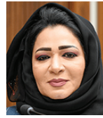
جميلة علي سلمان

أكدت جميلة علي سلمان النائب الثاني لرئيس مجلس الشورى، عضو اللجنة المعنية بتعزيز القانون الدولي الإنساني، أن الاتحاد البرلماني الدولي، من مملكة البحرين أثبتت تميزها وإيمانها على مستوى دول العالم فيما يتعلق بمواجهة التحديات المرتبطة بتفشي فيروس كورونا (كوفيد-19)، وذلك بفضل النهج الإنساني الذي اتخذه مع الجود الدولية لتخفيف معاناة هذه الشعوب.