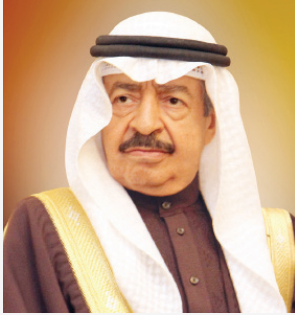
سو وزير رئيس الوزراء.

البحرين بقيادة جلالة الملك استطاعت أن تواجه التحديات الراهنة بفضل صلابه البنية التحتية التي أنجزتها في مختلف المجالات