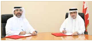
أثناء توقيع الاتفاقية

المنامة - بنا وقع وزير الأشغال وشؤون البلديات والتخطيط العمراني عصام خلف اتفاقية تنفيذ الأعمال الإنشائية للبرج الإداري والاستثماري لاحتياطي الأجيال القادمة المقرر تشييده على الواجهة البحرية بمنطقة خليج البحرين، وتمت ترسية المشروع من قبل مجلس ووقع وزير الأشغال وشؤون البلديات والتخطيط العمراني عصام خلف اتفاقية تنفيذ الأعمال الإنشائية للبرج الإداري والاستثماري لاحتياطي الأجيال القادمة المقرر تشييده على الواجهة البحرية بمنطقة خليج البحرين، وتمت ترسية المشروع من قبل مجلس مجموعة الغنّة، إحدى الشركات الوطنية الرائدة، بقيمة 23.4 مليون دينار، ليضم 38 طابقاً على أرض مساحتها 12 ألف متر مربع، ومساحة بناء تبلغ 63 ألف متر مربع، ويستغرق تنفيذها 24 شهراً وينتهي في الربع الأخير من العام 2022.