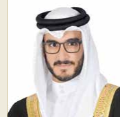
سمو الشيخ عيسى بن سلمان

صرح رئيس مجلس أمناء وقف عيسى بن سلمان التعليمي الخيري سمو الشيخ عيسى بن سلمان آل خليفة، أن الوقف يأتي تخليداً لذكرى سمو الأمير الراحل الشيخ عيسى بن سلمان آل خليفة (طيب الله ثراه)، وتحقيقاً للأهداف التي وضعاها عاهل البلاد صاحب الجلالة الملك حمد بن عيسى آل خليفة للوقف التعليمي الخيري، بإتاحة الفرصة أمام أبناء مملكة البحرين لاستكمال تعليمهم الجامعي، لما يمثله ذلك من دعم للعنصر البشري البحريني، وتأهيله للانخراط في شتى المجالات العلمية والمعرفية. جاء ذلك، بمناسبة الإعلان عن فتح باب الترشح للدفعة السابعة من بعثات الوقف لعام الأكاديمي 2020-2021، بدءاً من اليوم حتى الخميس المقبل. وأوضح أمين سر الوقف منى البوشي، أن باب الترشح سيكون مفتوحاً للطلبة خريجي المرحلة الثانوية الحاصلين على معدل 80% فما أكثر للحصول على البعثات. يمكن الراغبين في التسجيل لبعثات الوقف تحميل استمارة الترشح الموجودة في الرابط التالي: https://forms.office.com/ResponsePage/Pages/comp.aspx?id=oeT_Cpw_90aTVwafLBO6BMMIMeq45OIk0kwxjtz2g-