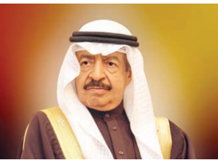
○ سمو رئيس الوزراء