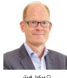
○ ميكيل فينتر

كتب علي عبدالحالق: أكد نائب الرئيس التنفيذي لشؤون الموارد والمعلومات ببوليتكنك البحرين رئيس لجنة أكاديمية الذكاء الاصطناعي الشيخ علي بن عبد الرحمن آل خليفة أن البحرين مهداة لإدخال أنظمة الذكاء الاصطناعي في منظومتها التعليمية، والدليل على ذلك أن العملية التعليمية قد استعرت بشكل فعال أثناء جائحة كورونا. من جهتها قالت نائبة الرئيس التنفيذي لشؤون الأكاديمية بالبوليتكنك، د.ريم الوائعين إن أخبار الخليج، إن التقنية وضعت خطة استراتيجية وثيقة تغطي الأعمار من ٢٠٢٠ حتى ٢٠٢٤ وفي تخصصات تعلمت الكلية وطموحاتها والإجتهاد الذي استغرق فيه البوليتكنك خلال الأعمار المقبلة.