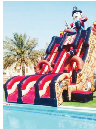
مؤسسة ترفيهية مهددة بالإغلاق.. يناشدون: لم يشملنا الدعم الحكومي رغم تضربنا الكبير!

وقد تم انتخاب النائب الثاني لرئيس مجلس الشورى ممثلاً عن المجموعة العربية في لجنة تعزيز احترام القانون الدولي الإنساني في الاتحاد البرلماني الدولي خلال أعمال الجمعية العامة ١٤١ في الاتحاد البرلماني الدولي، حيث تضمنت جهوداً واحتياجات اللاجئين خلال فترة الجائحة بهدف إلى حماية غير المماركين في النزاعات المسلحة، كما تسهم اللجنة في رفع الوعي بعملية اللاجئين والمخبرين الخاص بالبند الطارئ المعتمد في الجمعية ١٢٧ للاتحاد البرلماني الدولي بشأن وضع الروهينجيا، إلى جانب الإطلاع على التطورات الأخيرة في ميانمار وبنجلاديش.