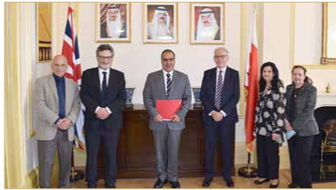
سفير مملكة البحرين لدى المملكة المتحدة بسفيل العوائل اليهودية البحرينية في لندن

بين مملكة البحرين ودولة إسرائيل، وقدمت العائلات الزائرة رسائل تهنئة موجّهة إلى جلالة الملك رغبة فيها إلى جلالة خالص التهنئة والتبريكات بمناسبة التوقيع على إعلان تأييد السلام