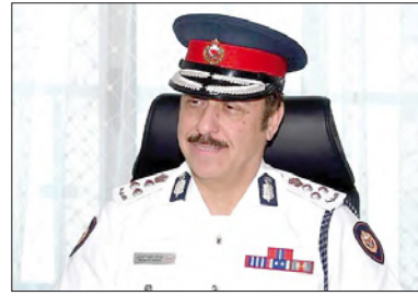
نائب محافظ المحرق

توجه العميد عبدالله خليفة الجبران نائب محافظ المحرق بخالص الشكر وعظيم الامتنان لفريق البحرين بقيادة صاحب السمو الملكي الأمير سلمان بن حمد آل خليفة ولي العهد نائب القائد الأعلى النائب الأول لرئيس مجلس الوزراء حفظه الله، على جميع الجهود المبذولة في مواجهة فيروس كورونا كوفيد-19 والتي أشادت بها منظمة الصحة العالمية والعديد من الهيئات والمنظمات العالمية. كما تقدم بالشكر والتقدير إلى الفريق أول الشيخ راشد بن عبدالله آل خليفة وزير الداخلية، وإلى الفريق طارق بن حسن الحسن رئيس الأمن العام، ومنتسبي وزارة الداخلية كافة؛ على جهودهم الحثيثة وعينهم الساهرة على أمن وأمان الوطن والمواطنين والمقيمين. وأكد العميد الجبران أن محافظة المحرق حملت على عاتقها، وفق نص القانون، دوراً أمنياً ومجتمعياً مهماً بما يضمن تقديم أفضل الخدمات للمواطنين والمقيمين على حد سواء، ولم يرتبط أداء المحافظة بفترة معينة أو وقت زمني محدد، بل على العكس من ذلك، فمُنذ إنشاء المحافظة ولغاية الآن فإنها تسهم في إنفاذ القوانين والأنظمة.