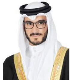
سو الشيخ عيسى بن سلمان.

أكد سمو الشيخ عيسى بن سلمان آل خليفة رئيس مجلس أمناء وقف عيسى بن سلمان التعليمي الخيري، أن الوفد يأتي تلبية لتكدي صاحب السمو الشيخ عيسى بن سلمان آل خليفة طيب الله ثراه، انطلاقاً من رؤية حضرة صاحب الجلالة الملك حمد بن عيسى آل خليفة عاهل البلاد المفدى لهذا الوفد التعليمي الخيري بما يحقق الأهداف المنشودة بإتاحة الفرصة أمام أبناء البحرين لاستكمال تعليمهم الجامعي. وأشار سموه إلى ما تطله هذه البعثات من دعم للشباب البحريني والاستثمار